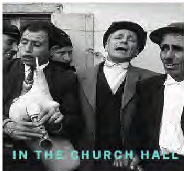
IN THE CHURCH HALL